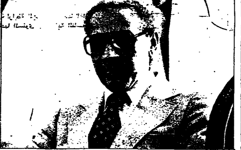
بو ستة: «ليس صحيحا أننا رفضنا الوساطات»

الوسطاء بين الجزائر والمغرب، وتردد الحديث عن وساطة سعودية تم عن وساطة تونسية لدى زيارة النير فهد الرباط ثم زيارة محمد مزالي الأخيرة. لماذا رفض المغرب هذه الوساطات؟ وما هي الشروط والضمائم التي يقبل في ظلها المغرب وساطة لـحل النزاع؟